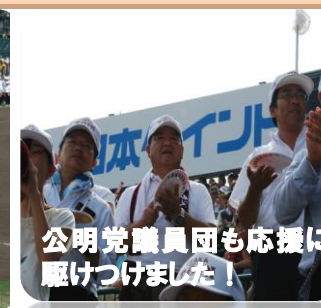
公明党議員団も応援に駆けつけました!

第94回全国高等学校野球選手権大会に出場した大阪桐蔭高校は、圧倒的な力で駒を進め、見事春の優勝に続く夏の3回目の優勝を果たし春夏連覇の偉業を達成しました!