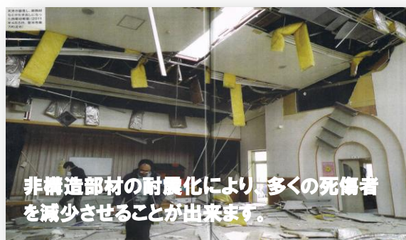
非構造部材の耐震化により、多くの死傷者を減少させることができます。

大東市公明党は本年6月議会一般質問で、公共施設の非構造部材の耐震化を急ぐよう要望。今9月補正予算の中でしっかりと予算化されました。今後3年間で設計施工を行い、まず全小中学校の耐震化を実施します。支柱や躯体の基本的な耐震化は終了したものの壁や天井、窓等の耐震化が課題でした。