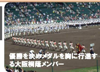
優勝を決めメダルを胸に行進する大阪桐蔭メンバー