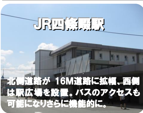
北側道路が16M道路に拡幅、西側は駅広場を設置。バスのアクセスも可能になりさらに機能的に。

長年の課題であったJR野崎駅・四條畷駅の再整備が動き出します。案として野崎駅は東西からの入場が可能な橋上化を基本とし、東西駅広場の設置で利便性が格段に向上します。四條畷駅は、旧170号線からのアクセス道を拡幅し西側駅広場の設置をめざします。10年がかりの事業ですが早期実現をさらに要望してまいります。