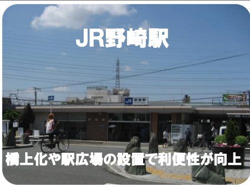
橋上化や駅広場の設置で利便性が向上

長年の課題であったJR野崎駅・四條畷駅の再整備が動き出します。案として野崎駅は東西からの入場が可能な橋上化を基本とし、東西駅広場の設置で利便性が格段に向上します。四條畷駅は、旧170号線からのアクセス道を拡幅し西側駅広場の設置をめざします。10年がかりの事業ですが早期実現をさらに要望してまいります。