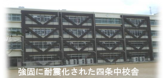
強固に耐震化された四条中校舎