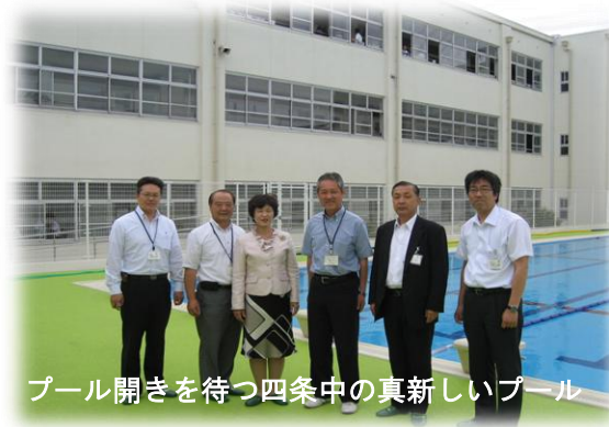
プール開きを待つ四条中の真新しいプール

四条中学校は耐震改修工事とあわせて、トイレの全面改修、プールは循環式へと転換、大変きれいな学校施設となりました。